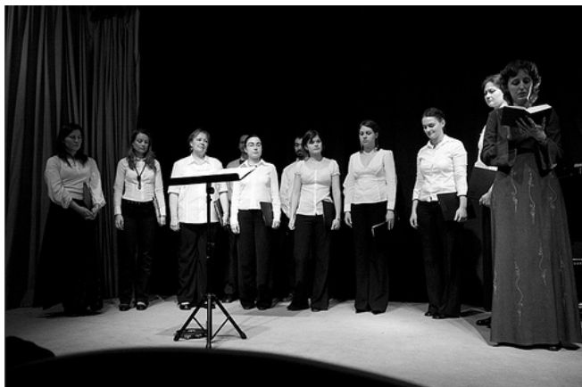
Színpadon a kórus...

A koncert utáni visszajelzések nagyon pozitívak. A kórus ígéretet kapott arra, hogy máskor is lesz alkalma énekelni a prágai közönségnek