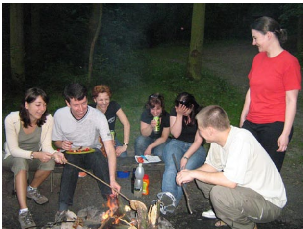
2008 első sütőgetése. Előtérben a sütőgetők, háttérben az iszogatók