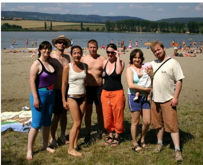
Csoportkép az Űsték-i tónál

Tovább robogtunk kb. 20 km-t a következő kempingig, ahol dübörgő diszkó- zene fogadott bennünket. Este fél 10 volt, mire végre sátrat ütöttünk egy nyugalmasnak tűnő helyen, s szokásunkhoz híven „terülj, terülj asztalkám“-ot varázsoltunk a sátrak közé terített pokrócon. Éjjel 1 óráig beszélgettünk, majd sátra-