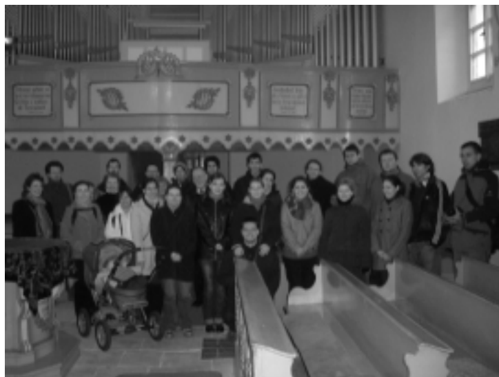
A Kántussal Libišben, 2008. novembere

vezése óriási feladat volt a gyülekezet számára. Szükség volt a gyülekezeti tagok összefogására és áldozatkészségére, hiszen 18 embert elszállását megoldani egy ilyen kicsi gyülekezet számára nem volt egyszerű feladat. Minden fáradtságot megért azonban a Kántus koncertje, melyre november 15-én került sor. Nagy megtiszteltetés volt a prágai kórus számára, hogy néhány ének erejéig együtt énekelhettünk a méltán híres debreceni Kántussal. Kórusunk meghívást kapott Debrecenbe – reménység szerint sikerül megfelelően felkészülnie a Kárpát-medencei Református Egyházak ünnepélyes egyesülése alkalmából május 22-én tartandó alkalomra, melyen több határon túli kórusral együtt szolgálhat.