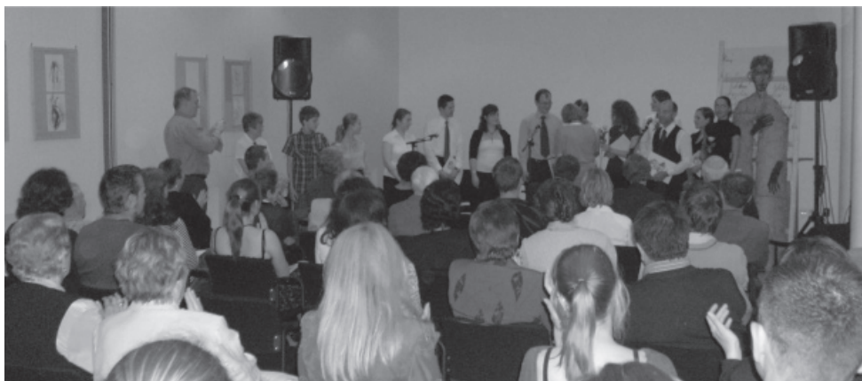
Radnóti emlékest a Nemzetiségek házában

Mindenestre a versek komor hangulata mindenkit magával ragadott, azt is, aki először hallotta őket, és azt is, aki már