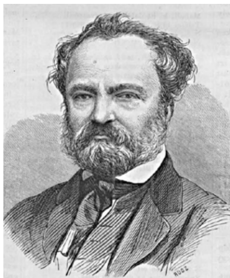
Erkel Ferenc (1810 - 1893)

trilla. Az ember bámulja, honnan szedte azt a sok melódiát.