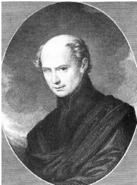
Kölcsey Ferenc (1800 - 1838)

A Hymnus zenéjére 1844-ben meghirdetett pályázat hatalmas érdeklődés mellett, óriási sikerrel zárult. Erkel Ferencnek – a Nemzeti Színház karmesterének – díjnyertes pályaműve már születése pillanatában nagy reményekre jogosított. Az 1844. július 2-i bemutató alkalmából így írtak róla a Honderű c. lapban: „... Most csak az van hátra, hogy Erkelünk` gyönyörű himnusát többször adassék alkalom hallani, megismerni, megtanulni, annak jelessége kezeskedik, hogy az nem sokára a legnagyobb népszerűséget vivandja ki magának, s valódi magyar néphymnussá válandik...” Az óhajítás sikerült. A magyar nemzet himnusává a közakarat tette. 1990-ben nemzeti jelképeink sorába a címer és a zászló mellé a Himnuszt is a Magyar Alkotmányba iktatta az Országgyűlés. (részlet az említett megnyitó ünnepség