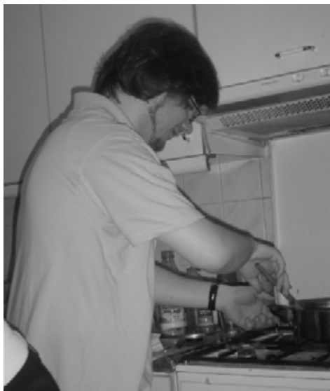
Norbi „in action”...

Őszintén mondom, hogy nekem ez nem tűnt fel. Szerintem maga az életetek az, amin látszik a hovatartozásotok... Nekem sokkal szimpatikusabb az, amikor a keresztyén keresztyénként él, és így van hatással a környezetére. Más. Sok olyan esetről hallottam, hogy egy-egy