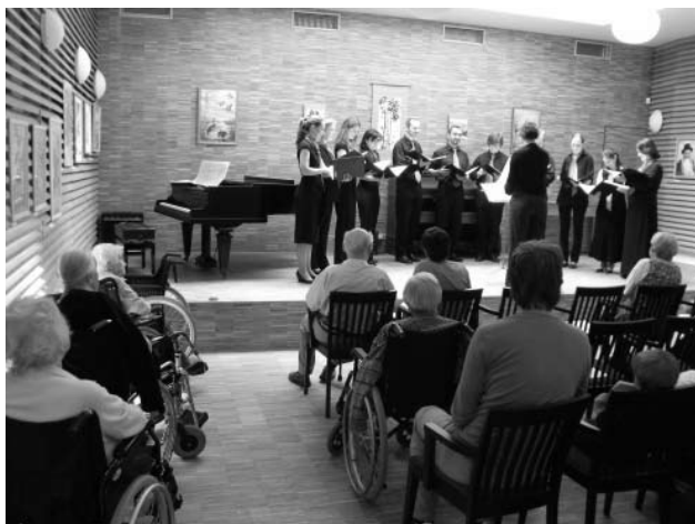
Kórusunk a Hagibor színpadán

A fellépések után a kedvem szárnyal, telve vagyok élménnyel. Nehezen találok vissza a szürke hétköznapiakba, a munka után nem vár rám szolmizálás, gyakorlás. A szintetizátor kis időre visszakerült megszokott helyére, a szekrény tetejére. Egy ideig nem lesznek énekszombatok, vasárnap is lehet sokáig aludni (már aki