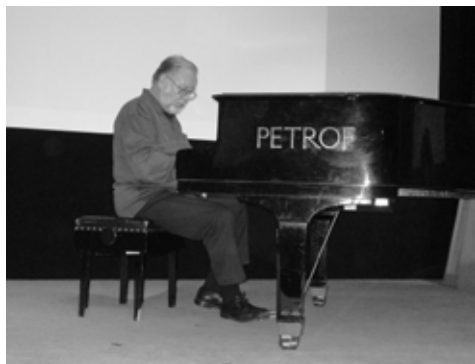
Az előadás előtt egy kis "bemelegítés" - Tanár úr a délutáni előadáson zongorajátékával kísérte a közönség énekét.