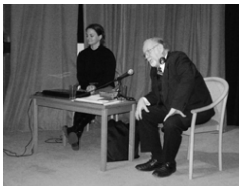
Végül sor került a hallgatói kérdésekre is.